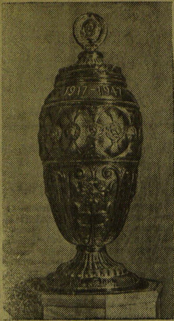
Серебряная ваза, преподнесенная товарищу И. В. Сталину латышским народом в связи с 30-летием Великой Октябрьской социалистической революции и новым годом.